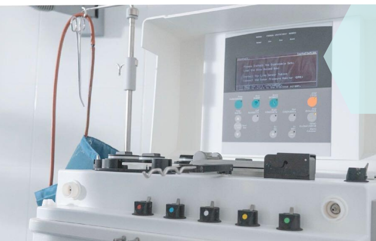
Плазмаферез - способ очистки крови и стимуляции обменных процессов в организме (омоложение).